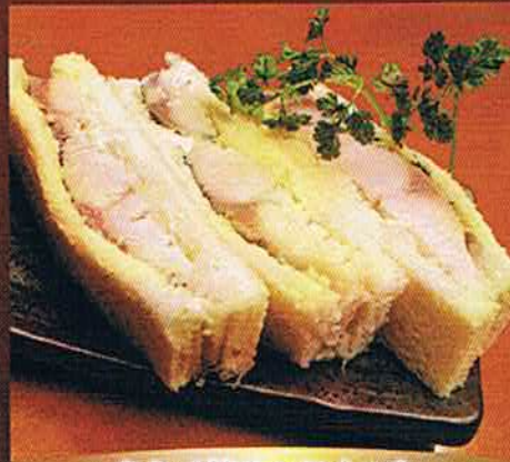
炙りメ鮭サンドイッチ