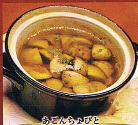
あごんちよびと マッシュルームのアヒージョ